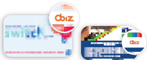
La carte possédant le logo Obiz® à l'avant ou au dos

C'est simple, l'adhérent devra présenter selon son affiliation :