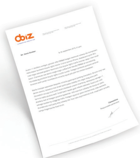
L'attestation signée par Obiz® téléchargeable dans l'espace Mon